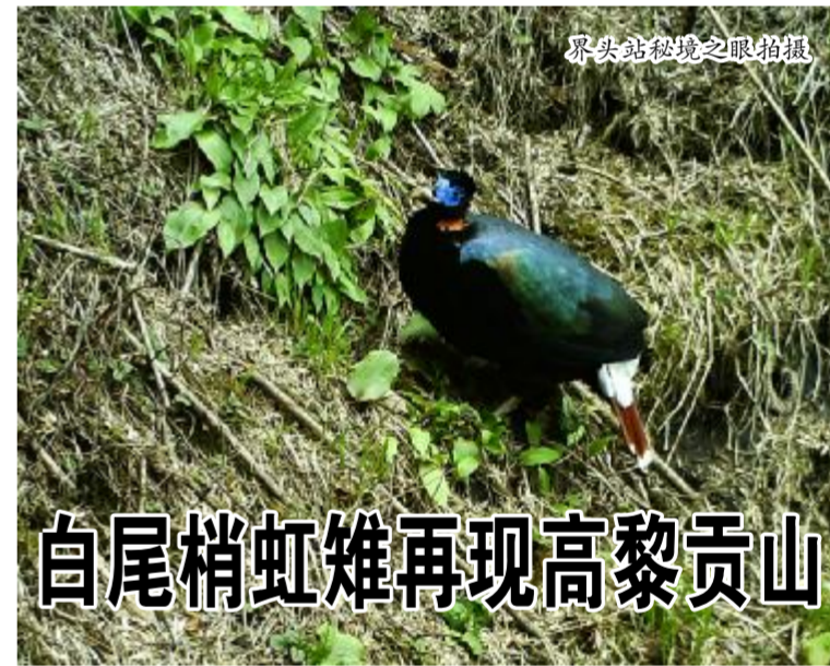
界头站秘境之眼拍摄